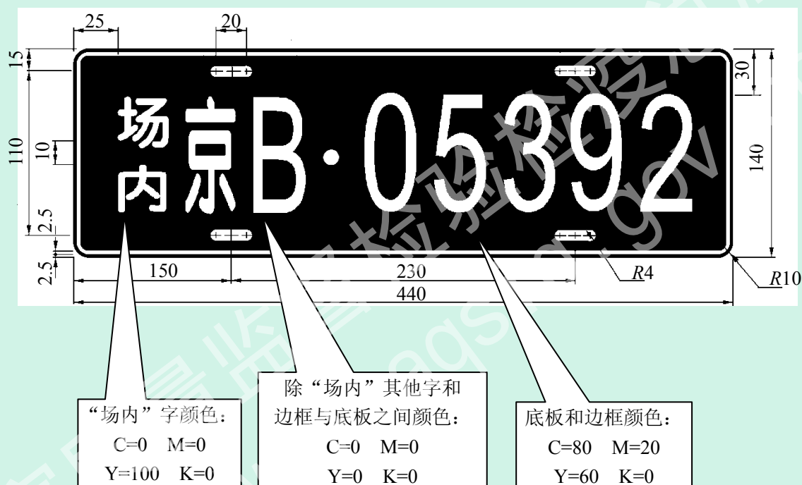
图 H 场(厂)内专用机动车辆车牌式样