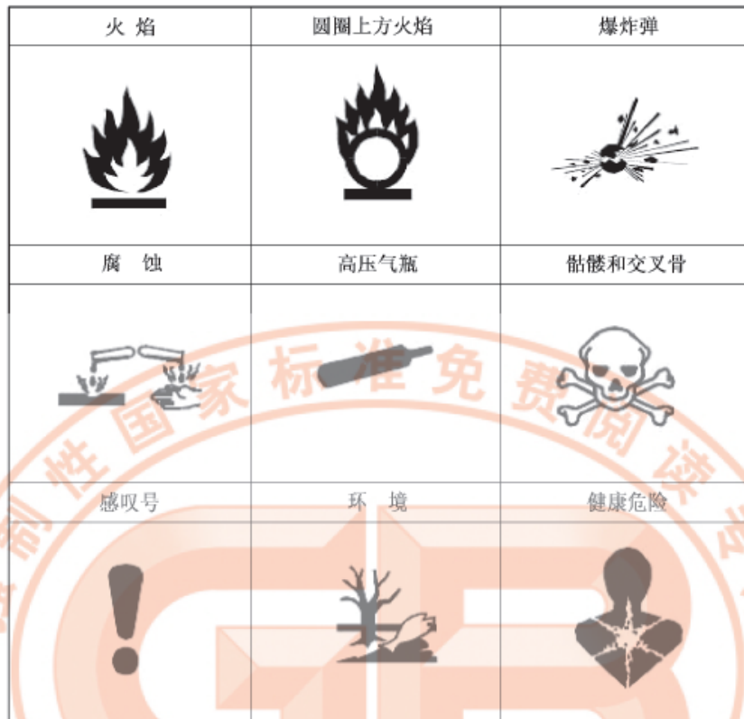
图 1 GHS 中应当使用的标准符号