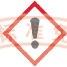
图 3 皮肤刺激物象形图